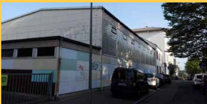
Die marode Turnhalle soll abgerissen werden.