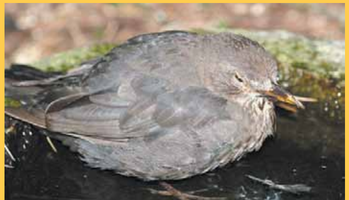
Am Usutu Virus erkrankte Amsel

Nach dem Ende der Mückensaison im November sind sinkende Fallzahlen zu erwarten. Wer im Sommer oder Herbst aufmerksam durch den Niddapark geht, sollte darauf achten, ob sich Amseln in Bodennähe aufhalten. Infizierte Tiere wirken krank (kahle Stellen am Kopf), unbeteiligt und fliehen nicht vor Menschen.