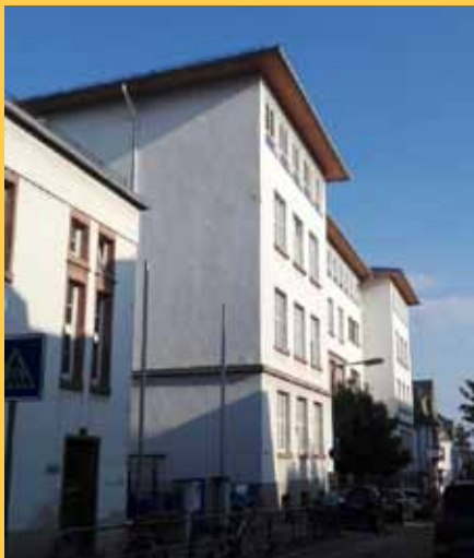
Das betagte Schulgebäude wird kernsaniert.

Wer Grundschüler fragt, weiß es bereits seit langem. Die Diesterwegschule ist baulich ein beklagenswerter Fall. Es regnet durch das Dach der Turnhalle und das Gebäude wirkt insgesamt alt und renovierungsbedürftig. Ein Zustand, den nun auch die Stadt Frankfurt als Missstand identifiziert hat. Das Hauptgebäude soll daher im Jahr 2018 kernsaniert werden. Die Neben-