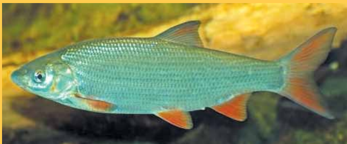
Die Nase

jedoch wandern können, um zu ihren Laichplätzen zu gelangen. Nur so kann der mühsam zurückgewonnene Fischbestand in dem Fluss erhalten bleiben. Die Stadtentwässerung Frankfurt hatte daher zwischen dem 20. Februar und dem 13. April für mehrere Wochen abschnittsweise die Niddawehre geöffnet. Ausgenommen waren das Höchster und das Rödelheimer Wehr. Diese Stauwerke sind bereits modernisiert und erlauben auch ohne Öffnung eine Fischwanderung.