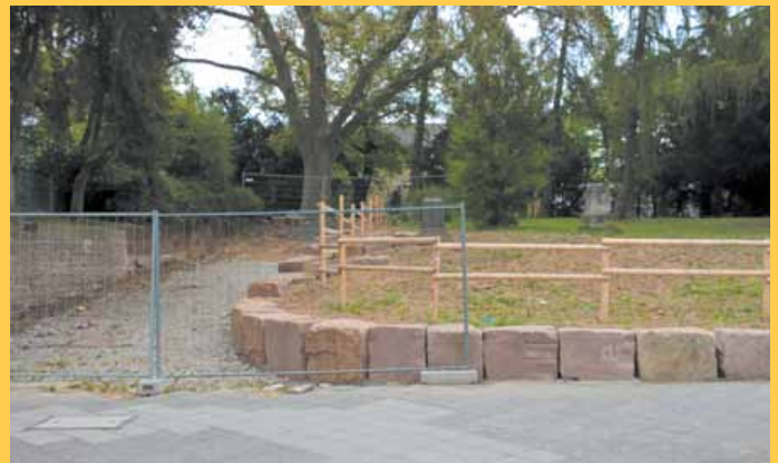
Der Alte Ginnheimer Friedhof: Ein Jahr nach dem Einsturz der Mauer noch immer eine Baustelle

Entgegen der Planungen des Grünflächenamtes der Stadt Frankfurt konnten die notwendigen Baumaßnahmen am Alten Ginnheimer Friedhof leider nicht bis zum Jahresende 2016 abgeschlossen werden. Der beauftragte Lieferant konnte die bestellten Sandsteinquader nicht mehr vor dem Wintereinbruch liefern. Während der Wintermonate und der Frostperiode war dann der Steinbruch geschlossen, weshalb auch kein Material ausgeliefert wurde. Herr Roser vom Grünflächenamt geht davon aus, dass die fehlenden 80 Steinquader bis Mitte Mai 2017 eintreffen. Im Anschluss kann die Stützmauer errichtet werden, was wiederum Grundlage für den Bau eines neuen barrierefreien Weges ist. Eine Bepflanzung des Geländes ist erst zum Abschluss der Baumaßnahmen vorgesehen. Sämtliche Arbeiten werden vom Grünflächenamt in Eigenregie erstellt. Da parallel Arbeiten in anderen Grünanlagen anstehen, kann aktuell kein konkreter Fertigstellungstermin für den Alten Ginnheimer Friedhof benannt werden.